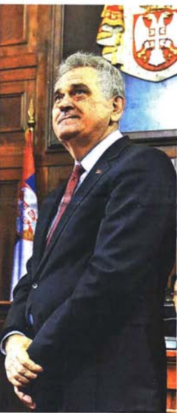
страна 6 Председник Томислав Николић